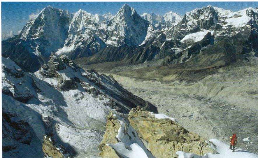
Expeditionsbergsteigen: am Nuptse-Westgrat

Kombiniertes Klettern in Eis und Fels ist bei vielen der oben genannten Spielformen gefordert. Aber es hat auch eine eigenständige Bedeutung. In Schottland etwa sind manche Wände nur begehbar, wenn Moos und Gras gefroren sind und den Eisgeräten Halt bieten –